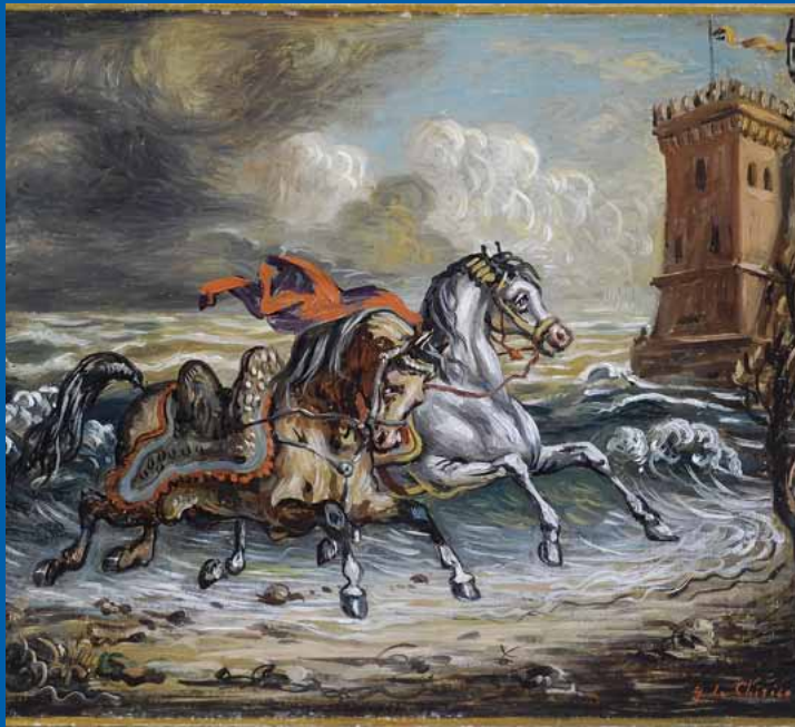
G. De Chirico: Cavalli sulla spiaggia che fuggono