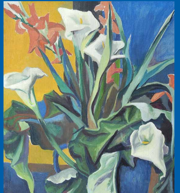
R. Guttuso: Calle

Opere di: Arman, E. Baj, A. Boetti, A. Corpora, G. De Chirico, L. Del Pezzo, P. Dorazio, R. Guttuso, M. Marini, P. Marussig, A. Pomodoro, M. Schifano, A. Sughi, V. Vasarely e altri