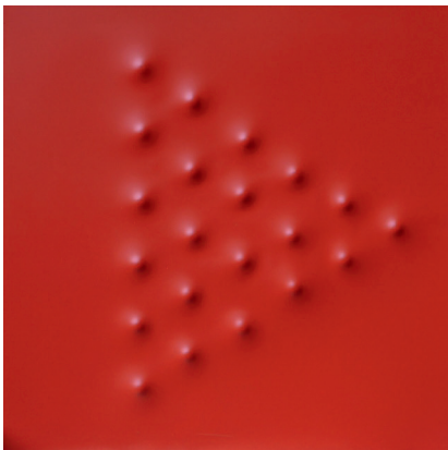
Angelo Brescianini: cm 62,5x62,5